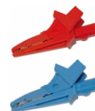
Coccodrillo 1 kV 20 A rosso / blu