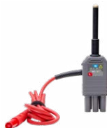
Adattatore WS-07 per la misura dell'impedenza dell'anello Z(L-N)