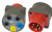
Adattatore presa trifase industriale 16 A / 32 A